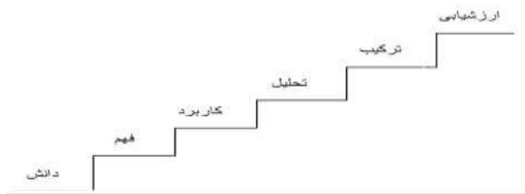
شکل ۱. سطوح مختلف حیطه شناختی

می‌رویم، حوزه فعالیت‌های شناختی عمیق‌تر می‌شود که این سطوح پلکانی، در شکل ۱ به تصویر کشیده شده است.