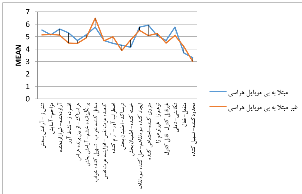
نمودار ۴. بعد فعالیت

در جدول بالا در ابتدا به منظور بررسی همسانی واریانس‌ها در دو گروه از آزمون لوین استفاده شده که نتایج آن همسانی واریانس‌ها در دو گروه را تأیید می‌کند ( p > 0/05 , F = 1/18 )، در نتیجه از ردیف بالای جدول جهت تعیین معناداری تفاوت استفاده شده است که نتایج حاکی از آن است که بین دو گروه تفاوت معناداری وجود ندارد ( p > 0/05 , t = 1 )