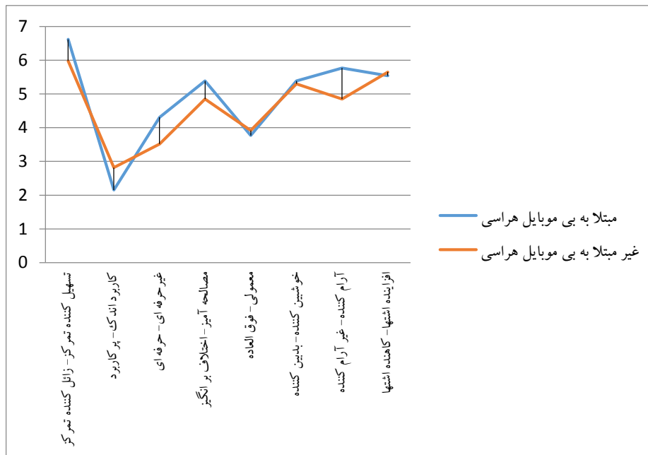
نمودار ۳. بعد توانایی

بر اساس نتایج نمودار بالا مشخص است که در اکثر جفت صفت‌ها نمرات میانگین گروه مبتلا به بی موبایل هراسی بیش از گروه دیگر است، اما جالب آن است که بیشترین تفاوت‌ها مربوط به جفت صفت‌های آرام کننده- غیر آرام کننده بودن است. ادامه در جدول زیر به مقایسه میانگین نمرات جفت صفت‌های توانایی در دو گروه پرداخته شده است.